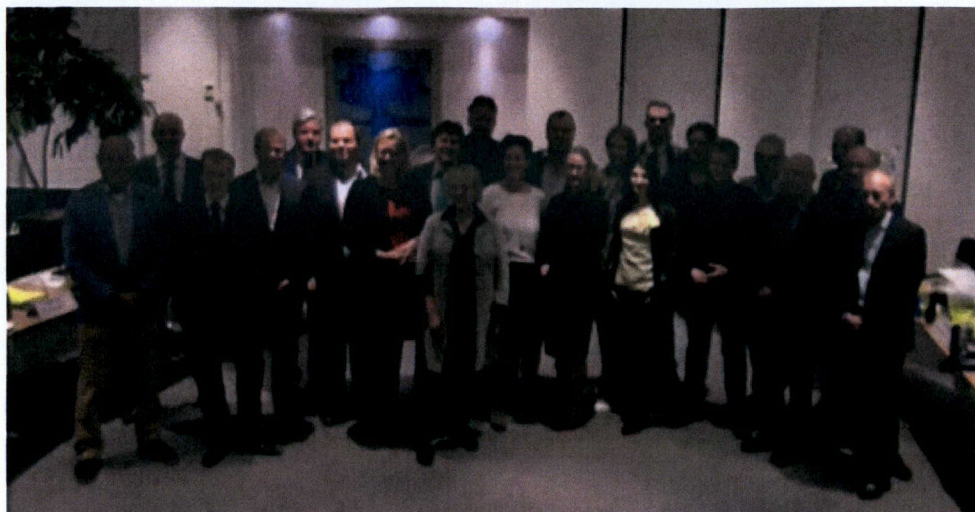
Gemeenteraad Nieuwkoop 29 maart 2018